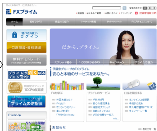
FXプライムウェブサイト http://www.fxprime.com/