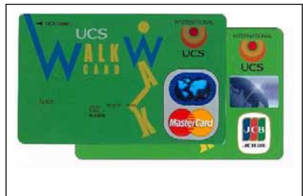
後日発送される本カード